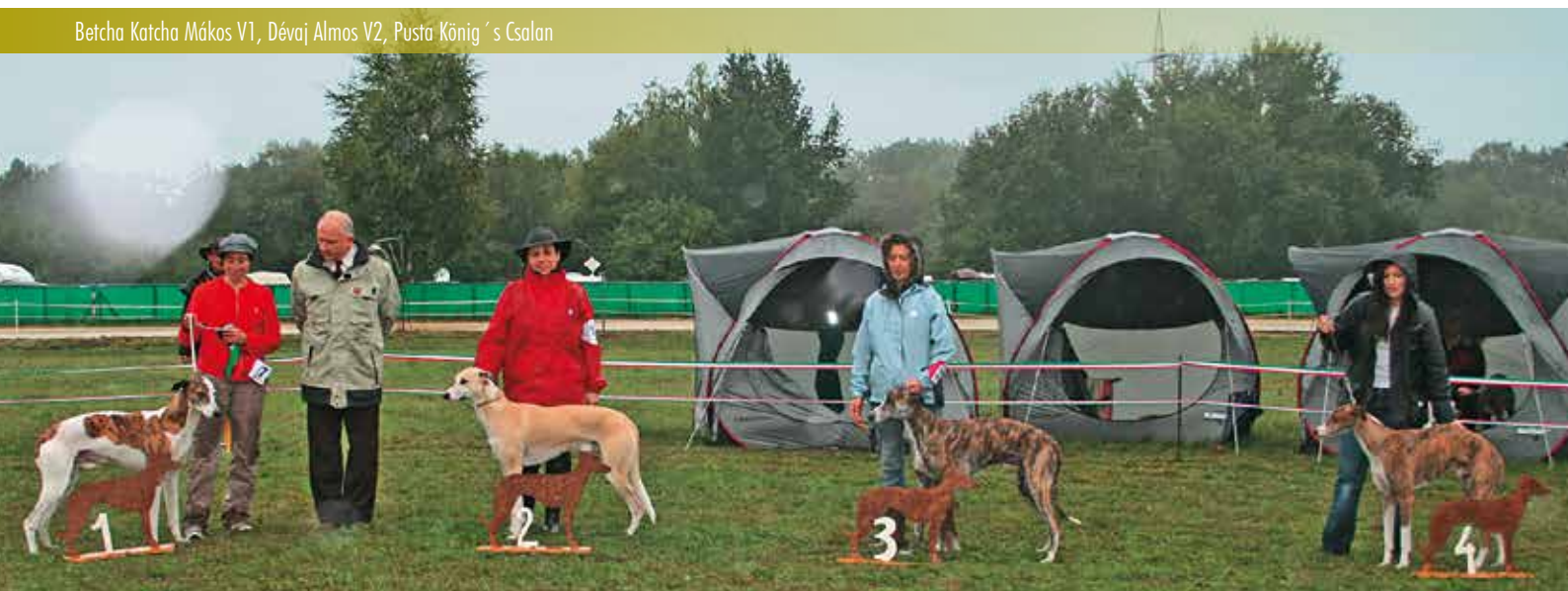
Betcha Katcha Mákos V1, Dévaj Almos V2, Pusta König 's Csalan