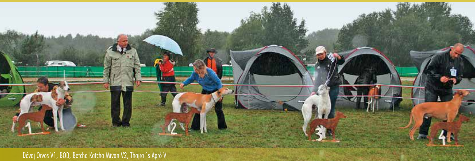
Dévaj Orvos V1, BOB, Betcha Katcha Mivan V2, Thajra 's Apró V