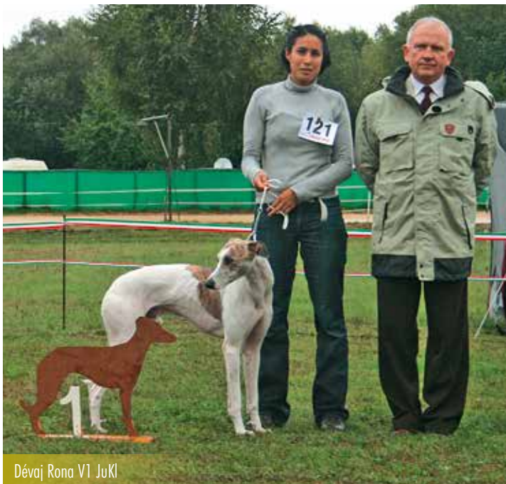
Dévaj Rona V1 JuKl