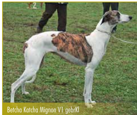
Betcha Katcha Mignon V1 gebrKl