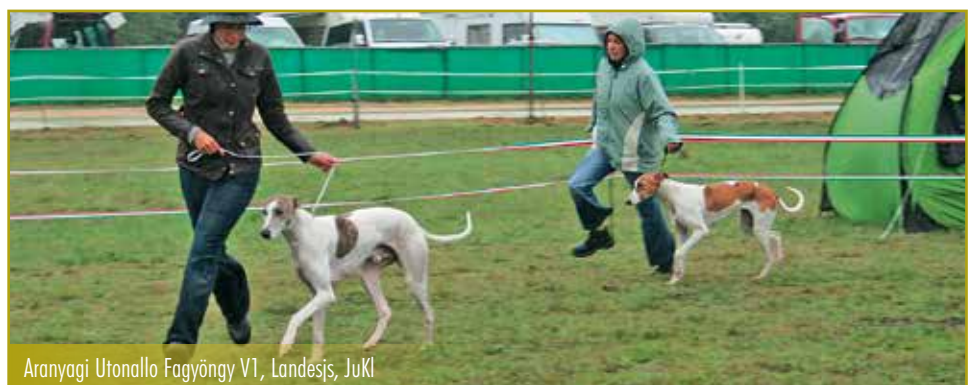
Aranyagi Utonallo Fagyöngy V1, Landesjs, JuKl