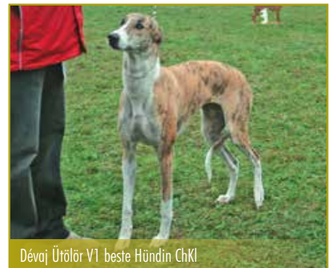
Dévaj Ütölör V1 beste Hündin ChKl