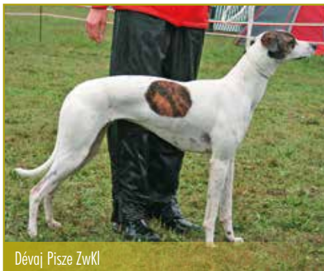
Dévaj Pisce ZwKl

Alles in allem zwar ein nasses und kaltes, aber fröhliches Wochenende.