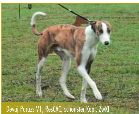
Dévaj Parázs V1, ResCAC, schönster Kopf, ZwKl