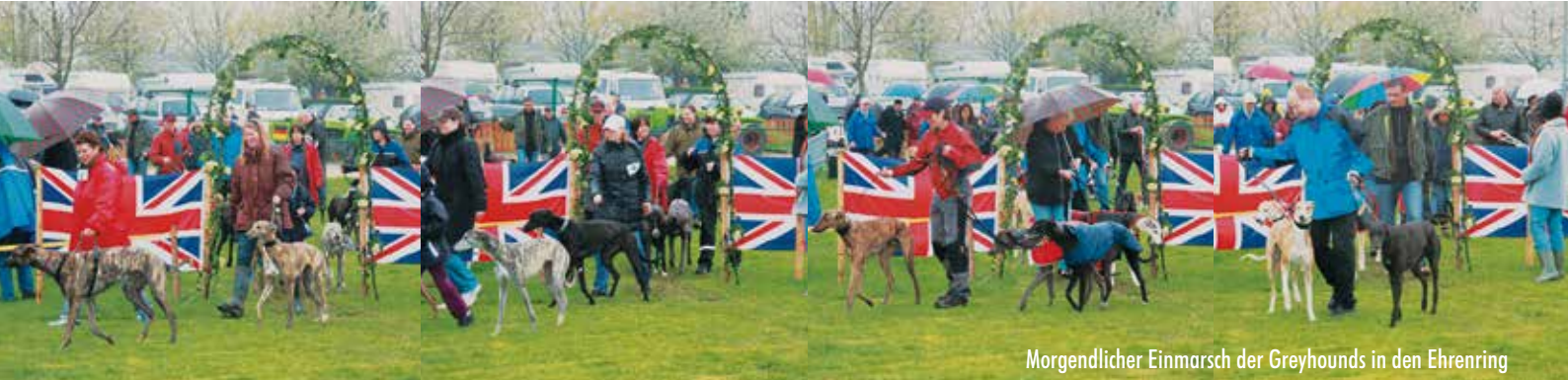
Morgendlicher Einmarsch der Greyhounds in den Ehrenring