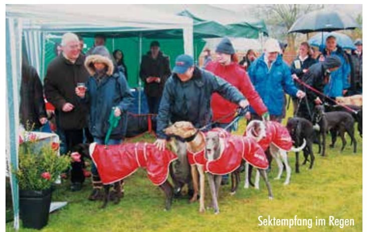
Sektempfang im Regen

stellung, und alle Greyhounds betreten mit ihren Besitzern den großzügig angelegten Ehrenring – begleitet von traditioneller schottischer Musik aus dem Dudelsack. Sehr beeindruckend, wie sie alle nach und nach ruhig und erhaben den Ring füllten – die Greyhounds, jeder für sich ein König – still und majestätisch kamen sie herbei, um sich mit ihren Besitzern im Ring zu treffen, der mit englischen Fahnen, Blumenkränzen und einem riesigen Gabentisch geschmückt