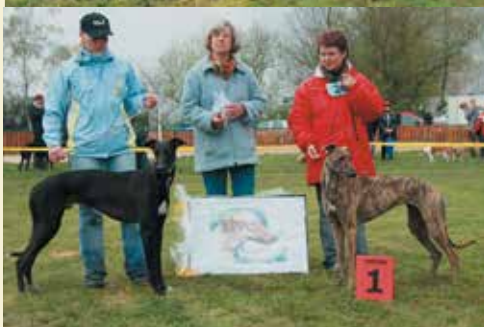
Die beiden Jahres- jugendsieger beim Stechen um's Jugend BOB: Special Hot Socks At Work (re.) + Velvet's Celtic Legacy (li.)