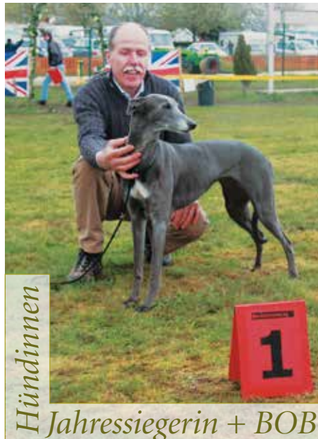
Hündinnen Jahressiegerin + BOB