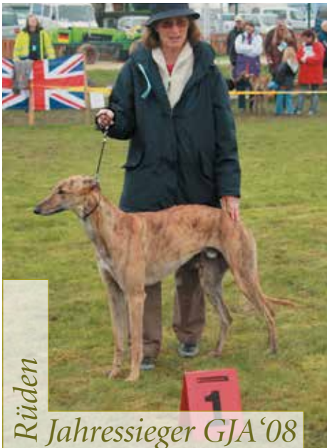
Rüden Jahressieger GJA '08