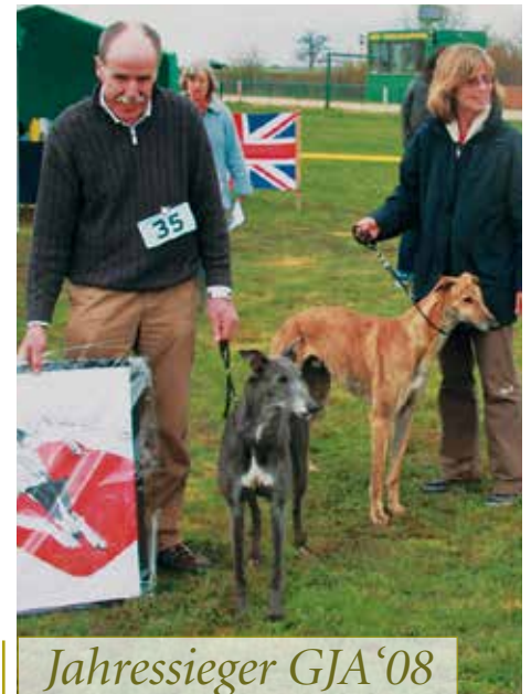
Jahressieger GJA '08