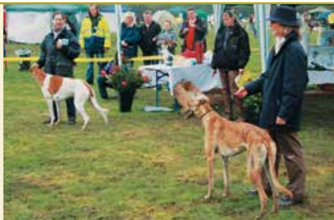
Das Stechen um den Titel bei den Greyhound-Rüden: Dahmranks Hangover + Asgard's Earl Affair