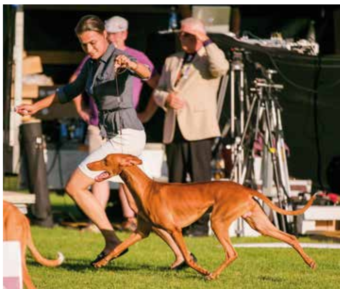
„BESTES GANGWERK“ !!!