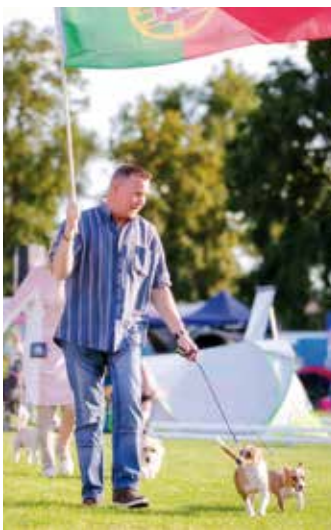
Hierzulande noch selten zu sehende Podenco Português – unter portugiesischer Flagge.