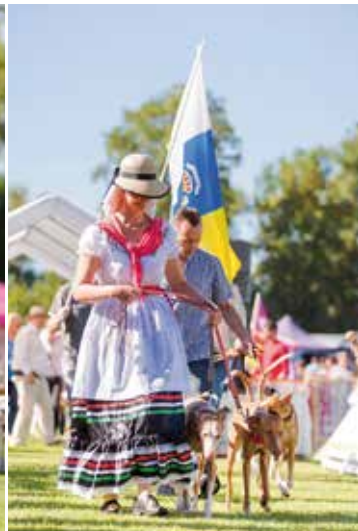
Die Windhunde der Kanarischen Inseln – präsentiert in typischer Landstracht.