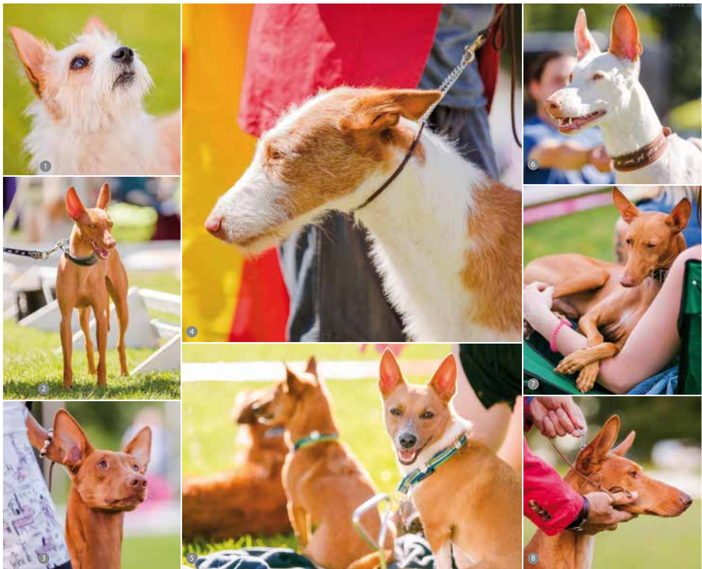
IMPRESSIOMEN: 1 Der kleine Podengo Portugues – Rauhaar. 2 Cirnecco dell'Etna – der kleine Kaninchen-Jäger aus Sizilien. 3 Der „Kelb-tal-Fenek“ – auch Pharaoh Hound, der Windhund aus Malta. 4 Der rauhaarige „Ibizian Hound“ – der Windhund von Ibiza. 5 Der besonders pffiffige Portugiesische Podengo (klein – in der Variante Kurzhaar) 6 Podenco Ibicenco – der kurzhaarige Vertreter mit Ursprung aus Ibiza. 7 Cirnecco dell'Etna 8 Kanarischer Windhund – Podenco Canario.

75 VERTRETER DER MEDITERRANEN RASSEN – 11 NATIONEN