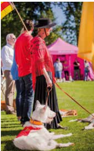
Vertreter der Mittelmeer-Insel Ibiza – mit Ibizian Hounds (Rauhaar).