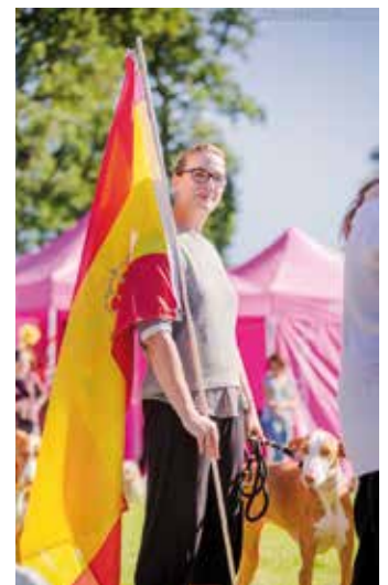
Der kurzhaarige Podenco Ibicenco unter spanischer Flagge.

75 Hunde fast aller mediterranen Rassen waren für die Jahresausstellung (der FCI-Gruppe 5) gemeldet. Teilnehmer aus 11 Nationen, viele begeisterte Züchter und Aktive kamen nach Donaueschingen. Hierzulande nur selten anzutreffende Rassevertreter aus ganz Europa waren zu sehen! Kaum ein Teilnehmer hatte weniger als 300 km Anreise – meist waren es 600 km. Für mediterranen-Fans aus