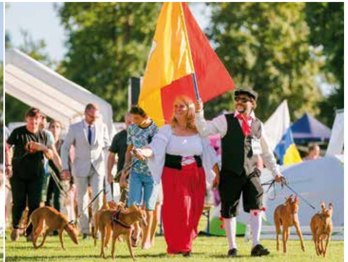
Die internationalen Teams der Cirnechi unter der regionalen Flagge Siziliens. Noch nie waren so viele Rassevertreter der kleinen Kaninchenjäger Siziliens hierzulande vertreten.