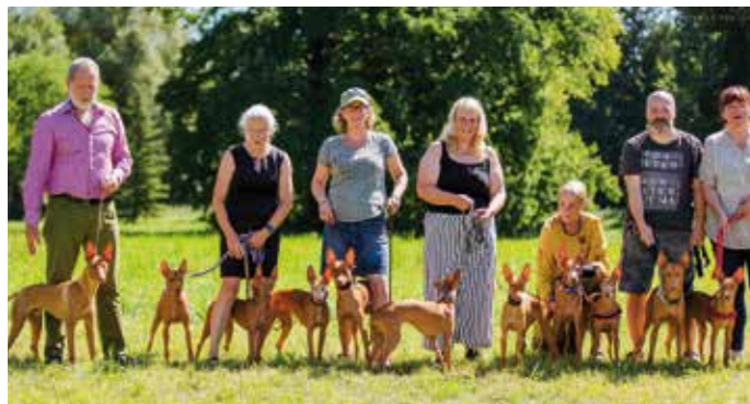
Cirneco dell'Etna Gruppenbild