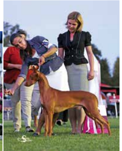
Der erfolgreichste Vertreter der mediterranen Rassen in Donaueschingen: 2. Best in Show aller Rassen – an beiden Tagen: Amtierender World Champion & Gruppensieger der FCI Gruppe 5 der World Dog Show 2016 in Moskau – Pharaoh Hound „Multi-Ch. Reedly Road Lynway“ (Reedly Road Desperado x Reedly Road Euphorica), Z.: & Eig.: Maria Evtееva, Moskau (RUS).