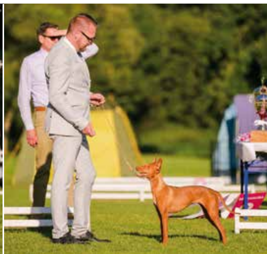
Rassebester Cirneco dell’ Etna & No. 2 aller Mediterranen Rassen in Donaueschinger – Cirneco Junior World Champion 2015 „Multi-Ch. Boxing Helena’s Not a Perfume“ (Ch. Totem del Gelso Bianco x Ch. Boxing Helena’s Gieeffeffe), Z. & Eig.: Bart Scheerens (BE)