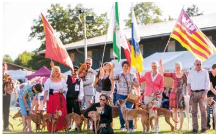
Mediterrane Rassen – in der Mitte der ganz seltene Podenco aus Andalusien.

Die Planung zur Jahresausstellung der mediterranen einmal selbst in die Hand zu nehmen, vieles anders zu machen und einmal neue Wege zu gehen war dann unsere Devise für 2016. Nicht alle Ideen durften wir umsetzen und manches verzögerte sich, schließlich bedurfte jede Entscheidung der Zustimmung des offiziell gewählten Zuchtkommissionsmitglieds. – Und dennoch: Gemeinsam mit den Organisatoren des Windhund