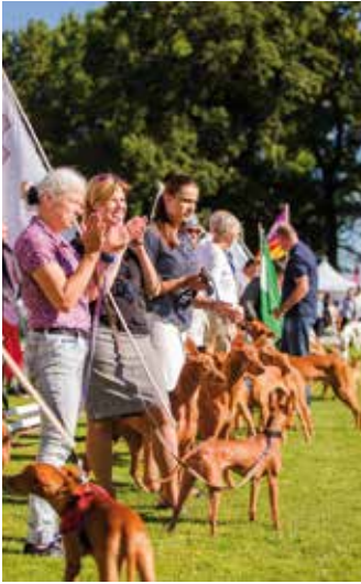
Ganz große Emotionen bei den Teilnehmern – und den vielen Besuchern zur Eröffnung des Events.