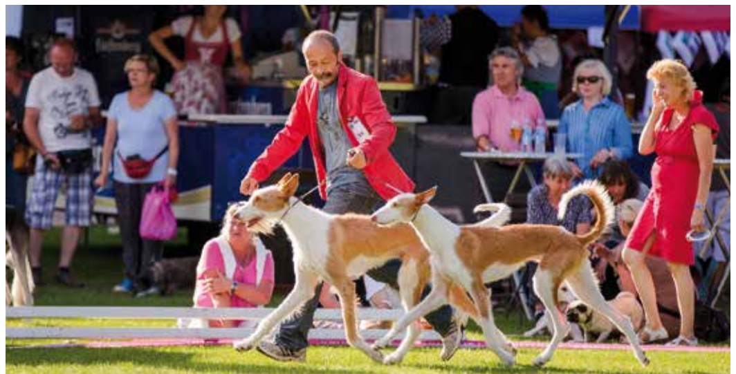
Podenco Ibicenco in Bewegung – „echte“ Windhunde aus Süd-Europa.