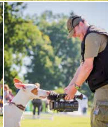
Die Eröffnung der Jahresausstellung 2016 – ein kamerareifes Spektakel.