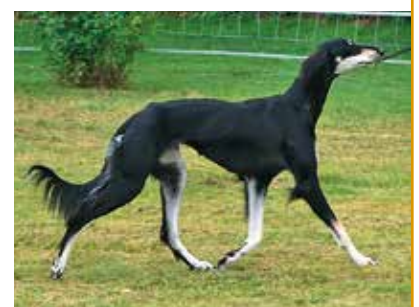
Ausstellung Hündin 2. Platz Jalisa al Badaia