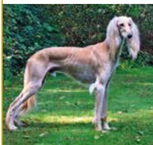
Ausstellung Rüde 3. Platz Zabarre Mata Shamir Bey