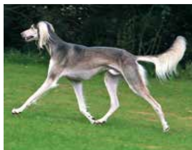
Ausstellung Rüde 3. Platz Ch. Brahmani Sawahin