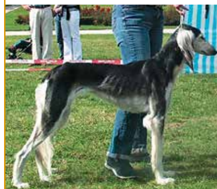
Ausstellung Hündin 3. Platz Yalameh Enya Samira