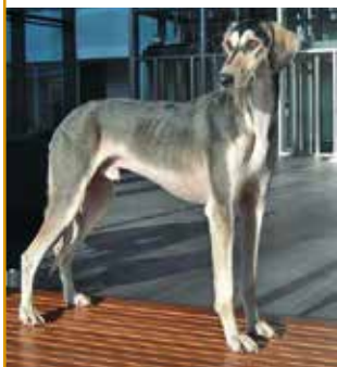
Ausstellung Rüde 1. Platz Bedu Efendi (smooth)