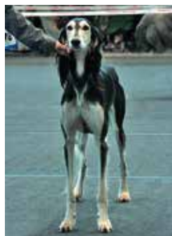
Ausstellung Rüde 2. Platz Ch. Yalameh Esmir Khan