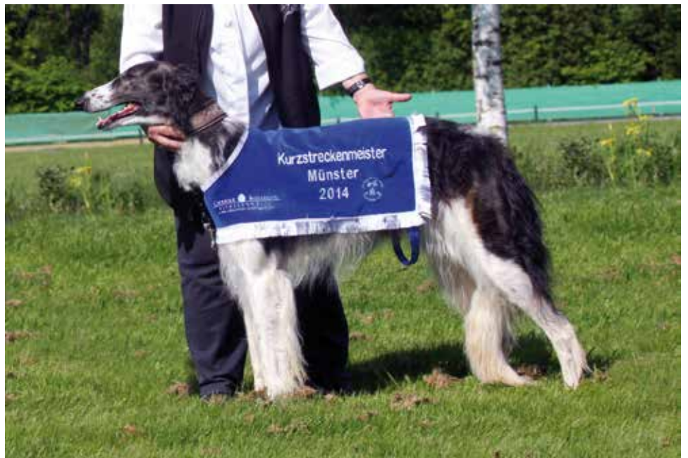
BARSOI-HÜNDINNEN/RENNEN 3. PLATZ Ondria aus dem Zarenreich

Der Wunsch für die Saison 2015: hier und da volle Barsoifelder – auch, wenn es angesichts der wenigen Gesamtzahl von Teilnehmern an Rennen immer recht schwierig bleiben wird. Aber die abgelaufene Saison hat gezeigt, dass es möglich ist!