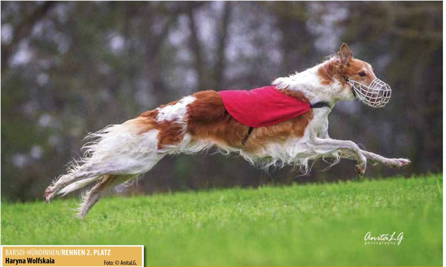
BARSOI-HÜNDINNEN/RENNEN 2. PLATZ