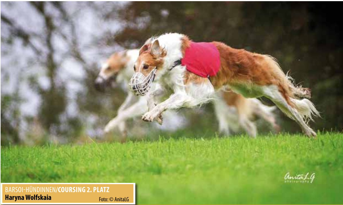
BARSOI-HÜNDINNEN/COURSING 2. PLATZ Haryna Wolfskaia