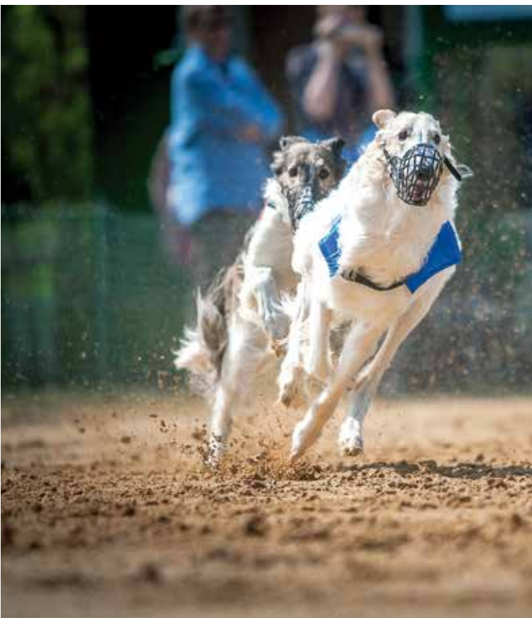
BARSOI-RÜDEN/RENNEN 2. PLATZ Rezvyi Veter Zlatoglaviy Zar

Rang 2 belegt ebenfalls ein vielversprechendes Nachwuchs-Talent, Rezvyi Veter Zlatoglaviy Zar . Er ging 7 mal an den Start. Zu Anfang ganz „Gentleman“ mit dem Abo für den 2. Platz, zeigte er Ende der Saison, dass er auch auf Sieg laufen kann – zweimal überquerte er als Erster die Ziellinie.