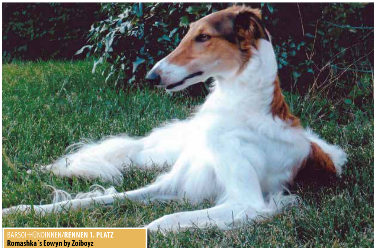
BARSOI-HÜNDINNEN/RENNEN 1. PLATZ Romashka's Eowyn by Zoiboyz