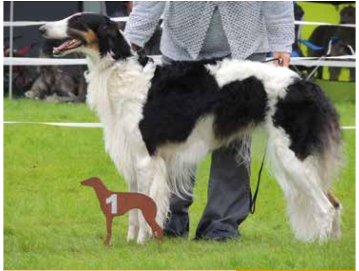
BARSOI-HÜNDINNEN/AUSSTELLUNG 3. PLATZ Philadelphia Sabanna Danijara