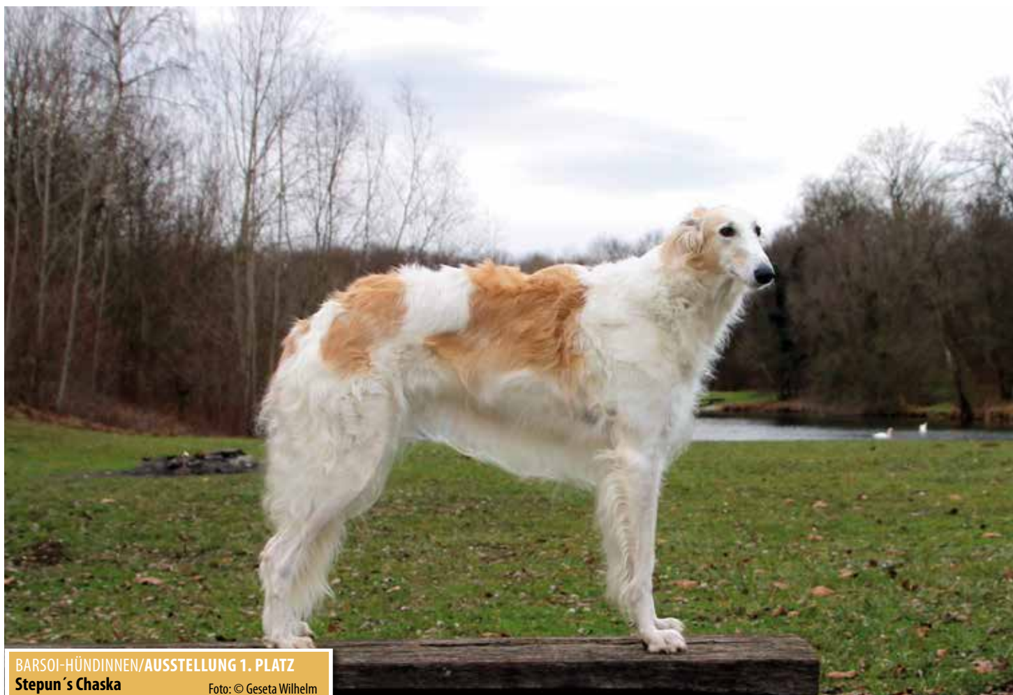
BARSOI-HÜNDINNEN/AUSSTELLUNG 1. PLATZ Stepun's Chaska

Den 3. Platz belegt die noch recht junge Philadelphian Sabanna Danijara , die sicher mit Leichtigkeit ihre Championate in 2015 vollenden wird.