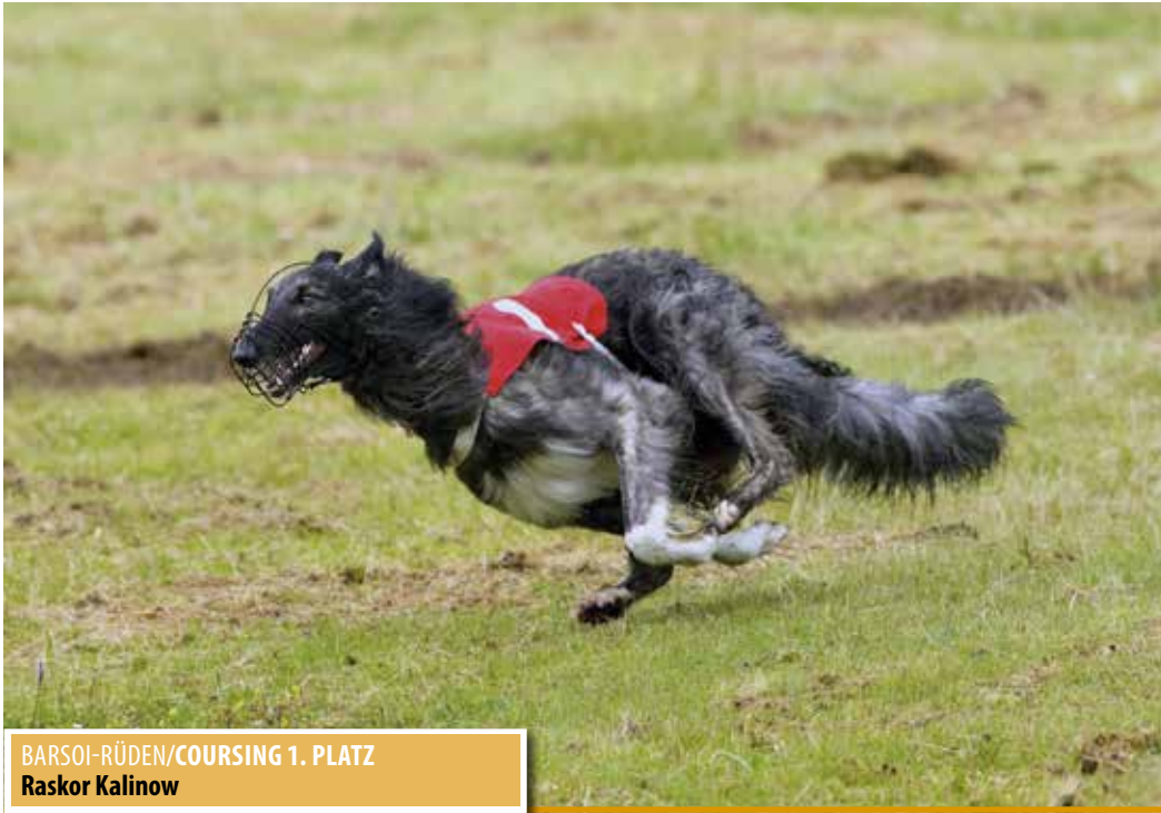
BARSOI-RÜDEN/COURSING 1. PLATZ Raskor Kalinow