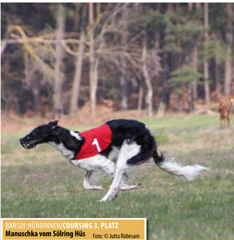
BARSOI-HÜNDINNEN/COURSING 3. PLATZ Manuschka vom Sölring Hü