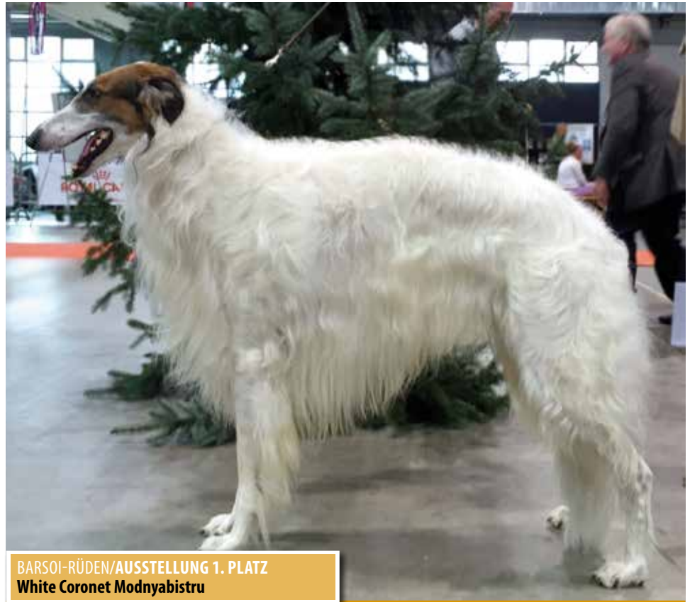
BARSOI-RÜDEN/AUSSTELLUNG 1. PLATZ White Coronet Modnyabistru