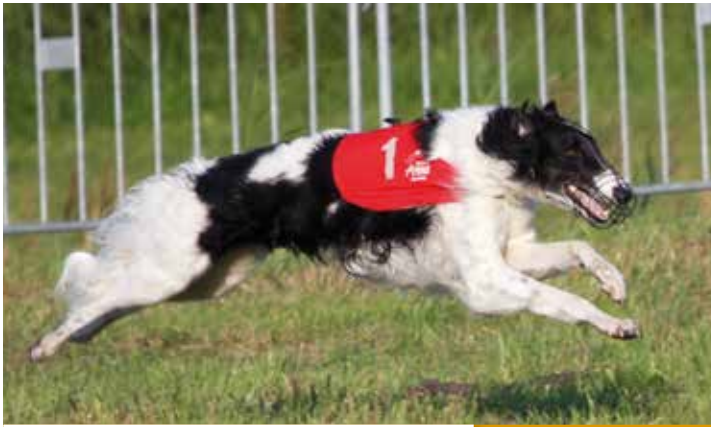
BARSOI-RÜDEN/COURSING 2. PLATZ Turgai's Korol