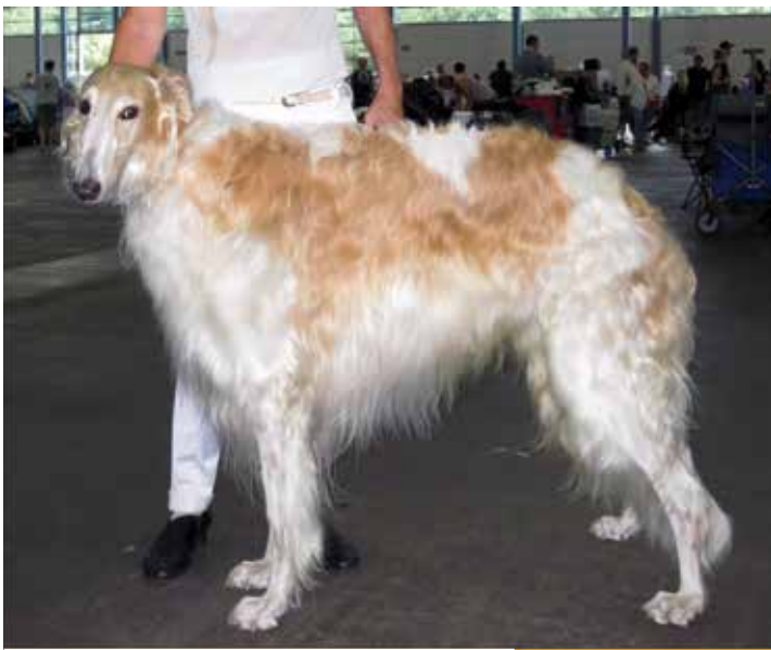
BARSOI-RÜDEN/AUSSTELLUNG 2. PLATZ Niemen Stepowy Goniec