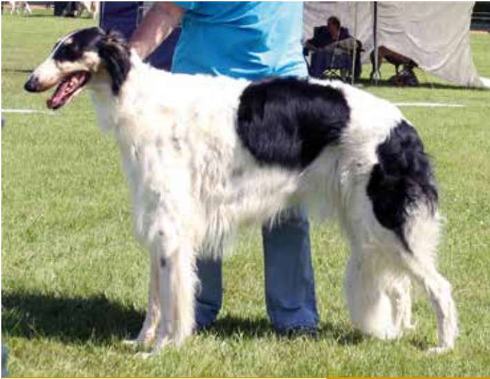
BARSOI-HÜNDINNEN/AUSSTELLUNG 2. PLATZ Ipatyev Hazi Cezarina Carevna