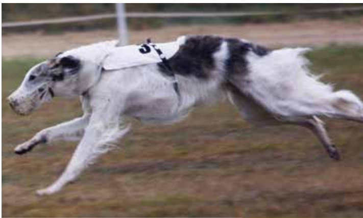
BARSOI-RÜDEN/COURSING 3. PLATZ Turgai's Keoma

DEUTSCHER CHAMPION FÜR SCHÖNHEIT & LEISTUNG