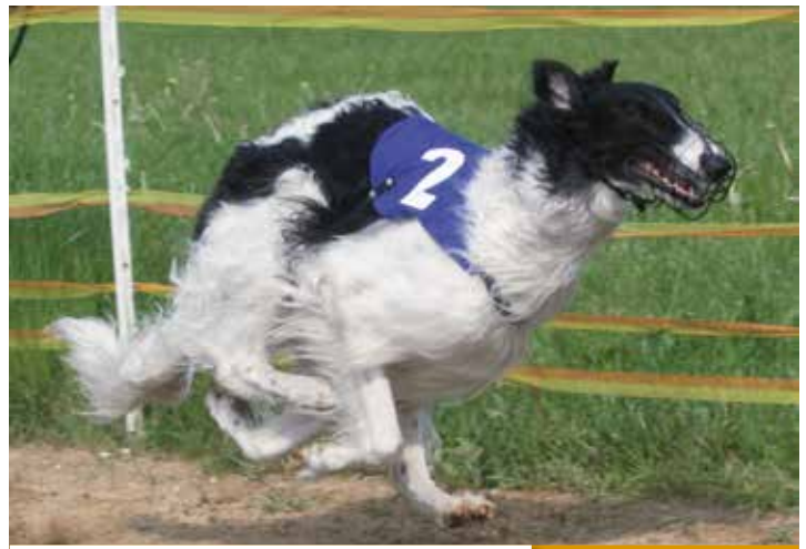
BARSOI-RÜDEN/RENNEN 3. PLATZ Turgai's Korol

Eine feste Größe in der Topliste ist Turgai's Korol . Mittlerweile fünffährig zeigt er immer noch enormen Kampfgeist und ließ so manch jungen Spund hinter sich.