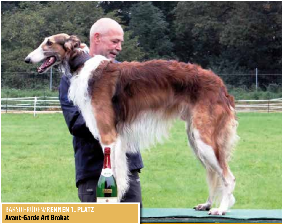
BARSOI-RÜDEN/RENNEN 1. PLATZ Avant-Garde Art Brokat

Die Rangliste der Rüden führt überlegen ein Neuling an, Avant-Garde Art Brokat . Der „Rote Blitz“ lieferte eine perfekte Saison ab: 5 Starts – 5 Siege – 5 Bahnrekorde! Zwei Titel nahm er dabei mit nach Hause: Er wurde Kurzstreckenmeister und Bundesrennsieger.