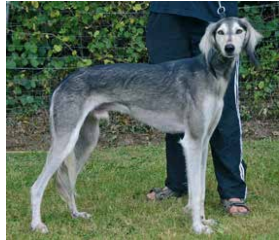
SALUKI-RÜDEN/RENNEN 1. PLATZ Ibn as Sabil el Riad