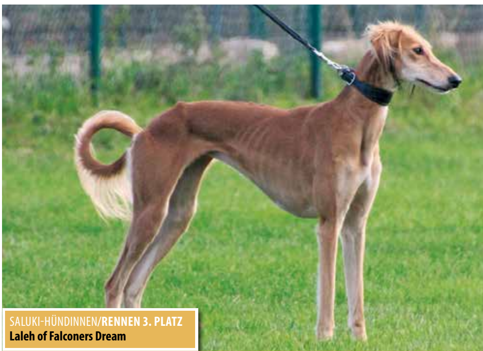
SALUKI-HÜNDINNEN/RENNEN 3. PLATZ Laleh of Falconers Dream