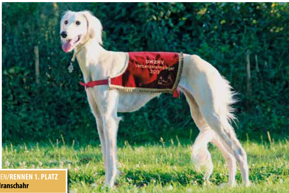
SALUKI-HÜNDINNEN/RENNEN 1. PLATZ Haftrangi Tizpa Irsanschahr