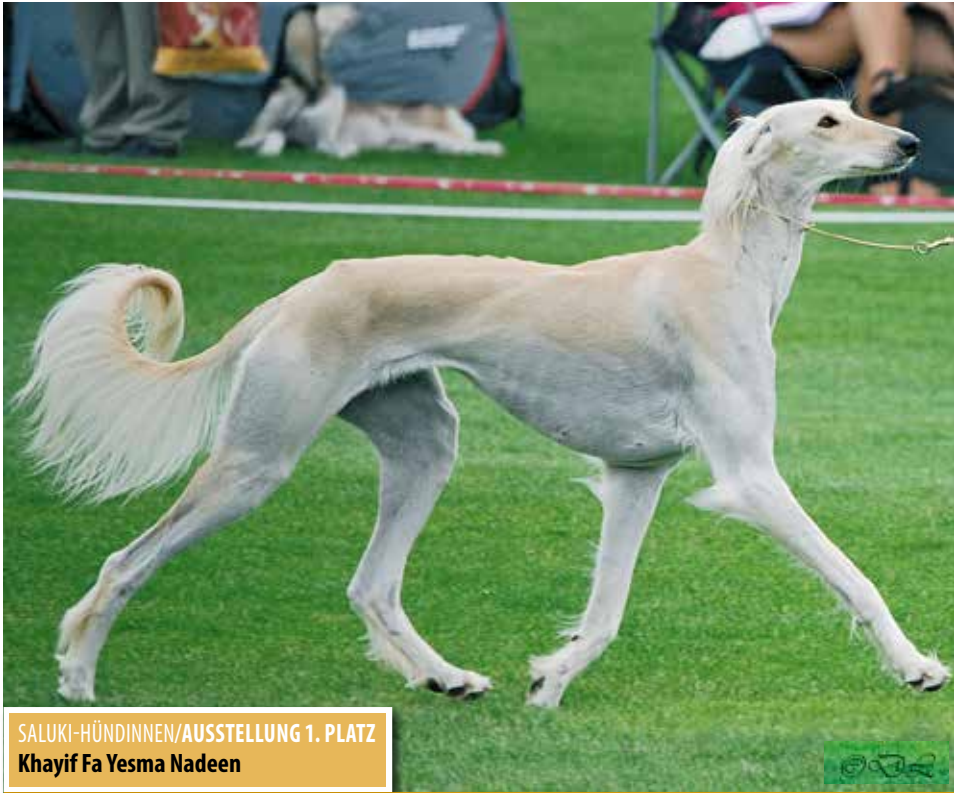
SALUKI-HÜNDINNEN/AUSSTELLUNG 1. PLATZ Khayif Fa Yesma Nadeen

Dieses Jahr ist die Ausstellungssaison schon nach 88 Ausstellungen beendet. Die Kritiker werden sagen, das reicht vollkommen. Doch rein statistisch gesehen ist es doch verwunderlich, dass die Meldungen bei weniger Veranstaltungen nicht mehr werden. Desweiteren ist ein Anstieg von Doppelveranstaltungen z. B. CACIB- und nat. VDH-Ausstellung zu verzeichnen. Seit diesem Trend ist auch ein Zugang an ausländischen Meldungen zu verzeichnen. 2011 haben 129 Rüden und 130 Hündinnen Punkte für die TOP-Liste bekommen, 2012 waren es 152 Rüden und 140 Hündinnen und in diesem Jahr 136 Rüden und 133 Hündinnen. Die Sieger und Platzierten der TOP-Liste können also zurecht stolz auf Ihre Leistungen sein.