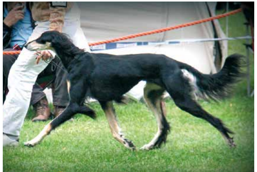
SALUKI-HÜNDINNEN/AUSSTELLUNG 3. PLATZ Simhearth Q-Ashanti Yalameh