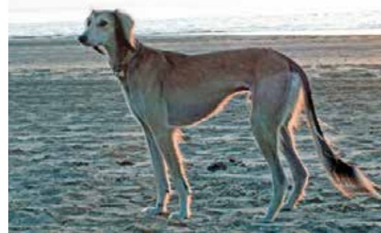
SALUKI-RÜDEN/RENNEN 2. PLATZ EmanKhan Al Djiibaajah