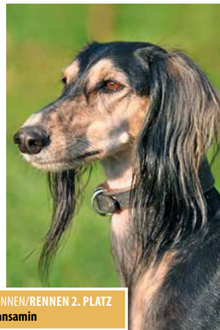
SALUKI-HÜNDINNEN/RENNEN 2. PLATZ Uschin von Iransamin