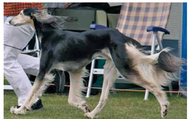
SALUKI-RÜDEN/AUSSTELLUNG 2. PLATZ El-Ubaid's Maharadja