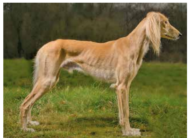
SALUKI-RÜDEN/AUSSTELLUNG 3. PLATZ Kirman Donatus