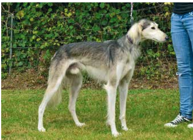
SALUKI-RÜDEN/RENNEN 3. PLATZ Ibn as Samum el Riad