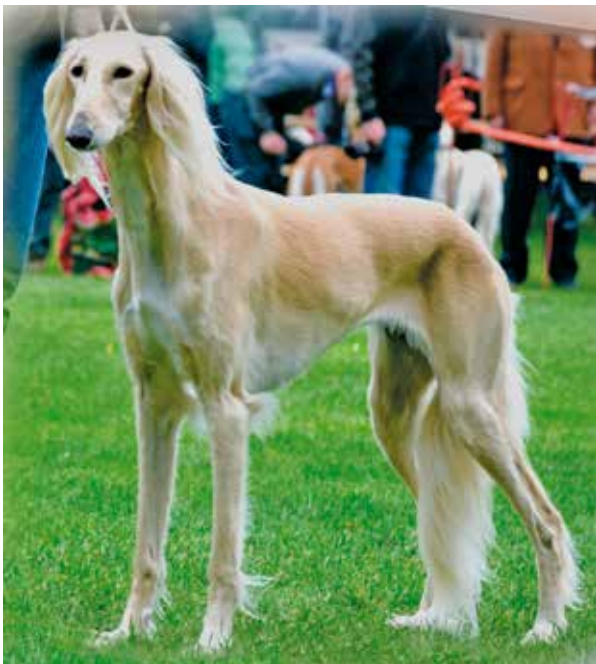
SALUKI-HÜNDINNEN/AUSSTELLUNG 2. PLATZ Aila Ziba Mashregh Baad AlQom

Den kompletten Bericht der Saison 2013 ist auf www.saluki-infoworld.de zu finden.