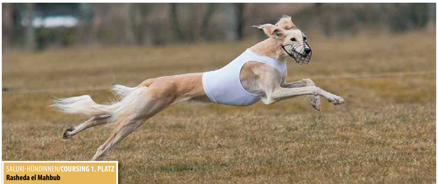
SALUKI-HÜNDINNEN/COURSING 1. PLATZ Rasheda el Mahbub