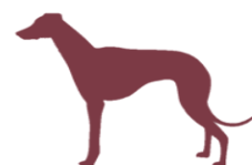
Foto: Greyhound- JAS 2024

Wichtig: Wir suchen noch jemanden, der die Erstellung der Ausstellungsrangliste für 2025 übernimmt. Bitte meldet Euch bei Interesse unter zkm-g@dwzrv.com !