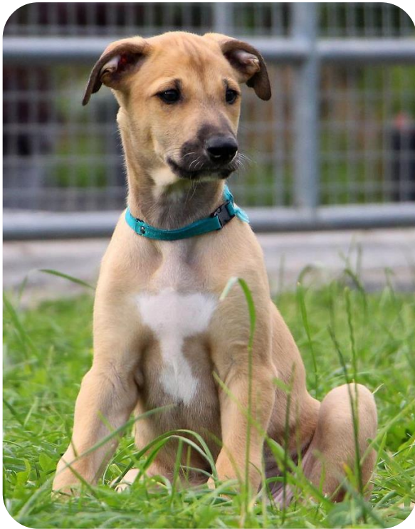
Greyhound-Welpen mit "Jugendmaske" und dem Genotyp E/E A^y/A^y k^y/k^y

Die Information, ob ein Greyhound eine „ Maske “ trägt (durchgehend dunkel gefärbter Fang) liegt ebenfalls auf dem E-Locus. Auch hier scheint eine „echte Maske“ (Genotyp EM/- ) eher selten vorzukommen. Was wir hingegen oft bei sandfarbenen oder gestromten Greyhounds sehen, ist die sogenannte „Jugendmaske“, die im Laufe des ersten Lebensjahres verschwindet und wo die Hunde nachweislich keinen genetischen Maskenfaktor tragen (Beispiel links im Bild).